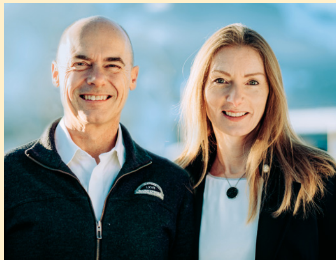
bezahlte Einschaltung

Um all das Organisatorische abzukürzen, reicht im Trauerfall der Anruf beim Bestatter. Beim Erstkontakt werden die persönlichen Daten aufgenommen und in der Folge die notwendigen Schritte der Reihe nach koordiniert und organisiert – immer in Abstimmung mit den Angehörigen. Anstatt „von A nach B“